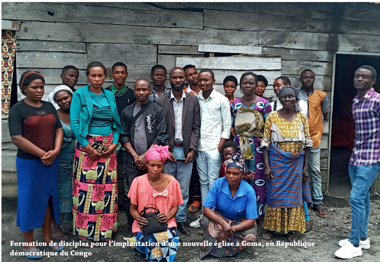
Formation de disciples pour l'implantation d'une nouvelle église à Goma, en République démocratique du Congo