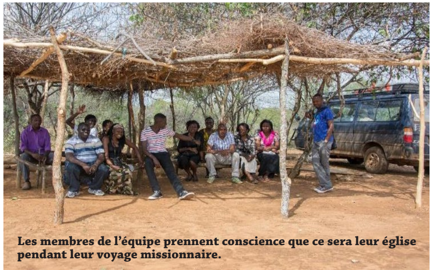
Les membres de l'équipe prennent conscience que ce sera leur église pendant leur voyage missionnaire.